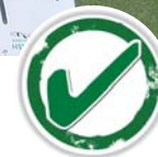
Bild ②: Die «Magische Kombination» – Putter-Pfad und Ausrichtung der Schlagfläche passen zueinander